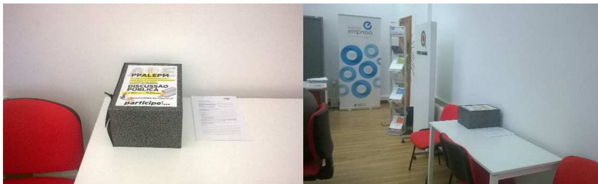
Figura 2 - Disponibilização de elementos para consulta, no Gabinete de Atendimento ao Múncipe

Para consulta, estiveram disponíveis os seguintes elementos: