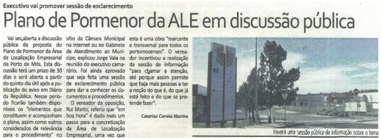
Figura 3 - Publicitação do período Discussão Pública no jornal "O Portomosense", de 6 de dezembro 2018