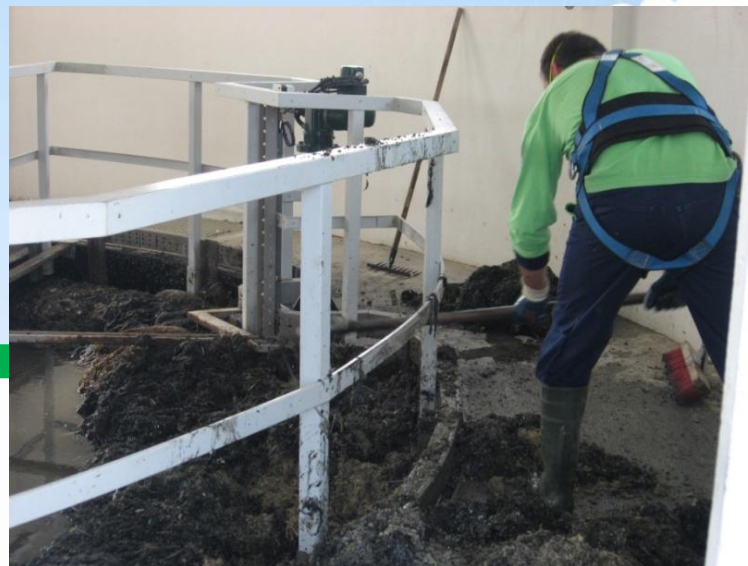
REPARTIDOR DE CAUDAIS