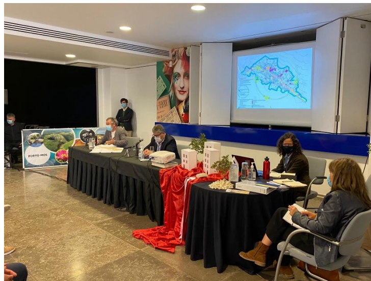
Fotografia 1.1 | Apresentação da 2.ª Sessão Pública

Após a Sessão Pública foi solicitado aos participantes, via online , que respondessem a um simples inquérito para validação da informação partilhada. Os resultados encontram-se explanados nos capítulos seguintes do presente documento.