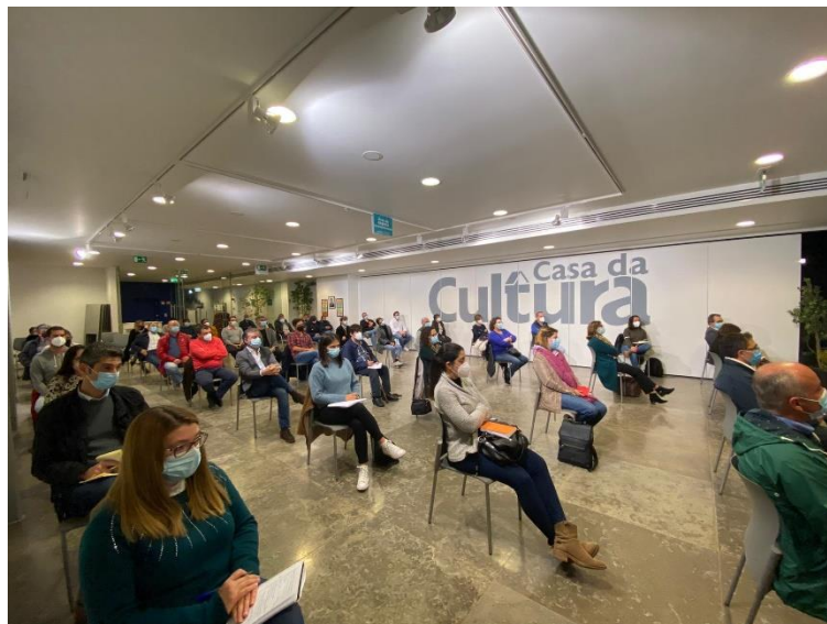
Fotografia 1.2 | Participantes da 2.ª Sessão Pública