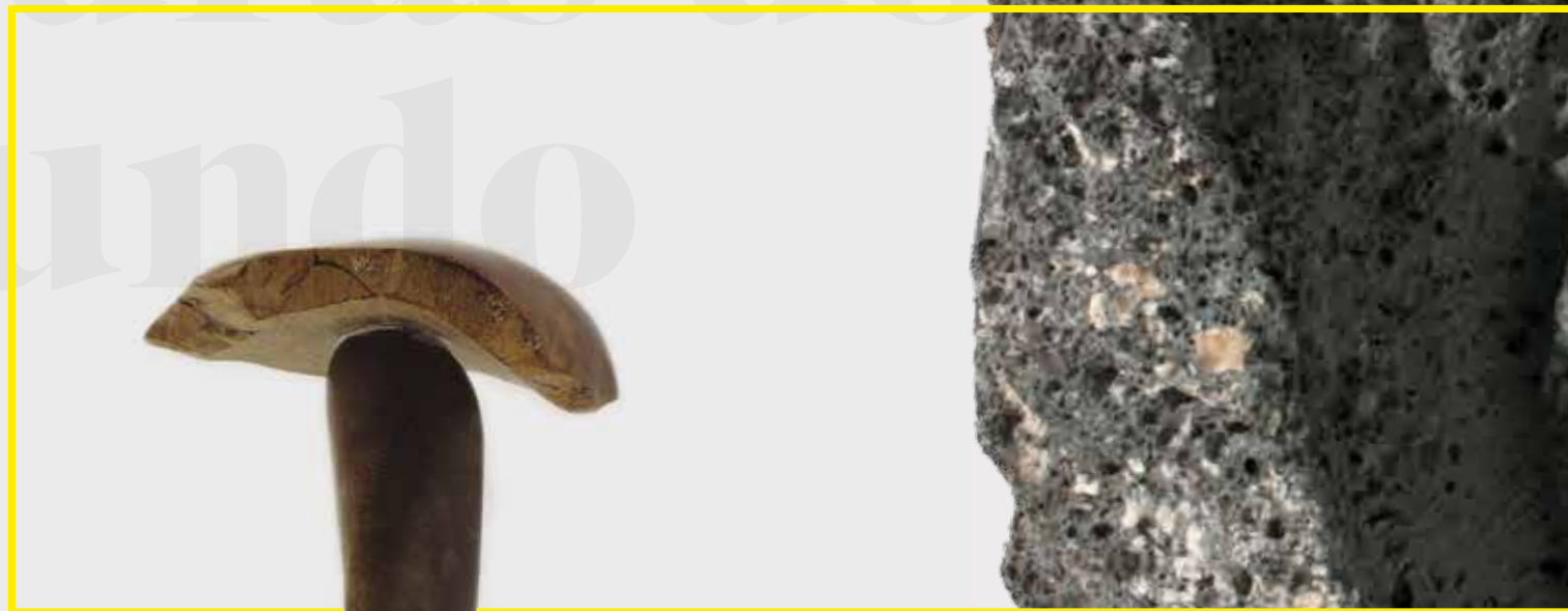
PEDRA DO MUNDO PM_065 ESCULTURA NA PEDRA, 13x9x9 CM TOSCANA, ITÁLIA