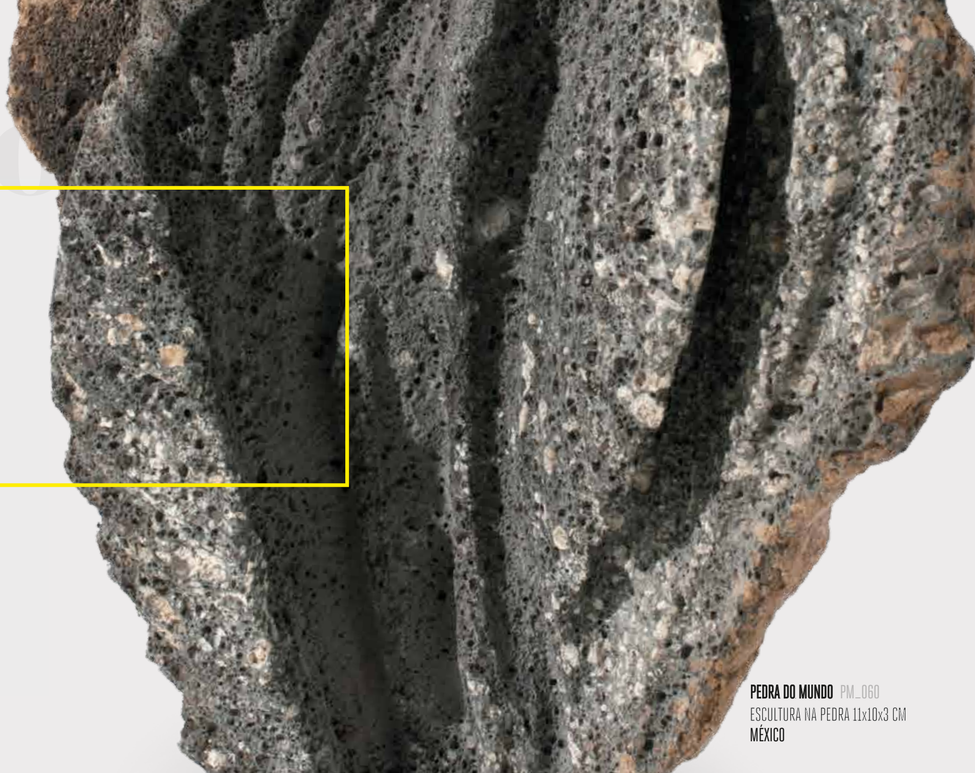
PEDRA DO MUNDO PM_060 ESCULTURA NA PEDRA 11x10x3 CM MÉXICO