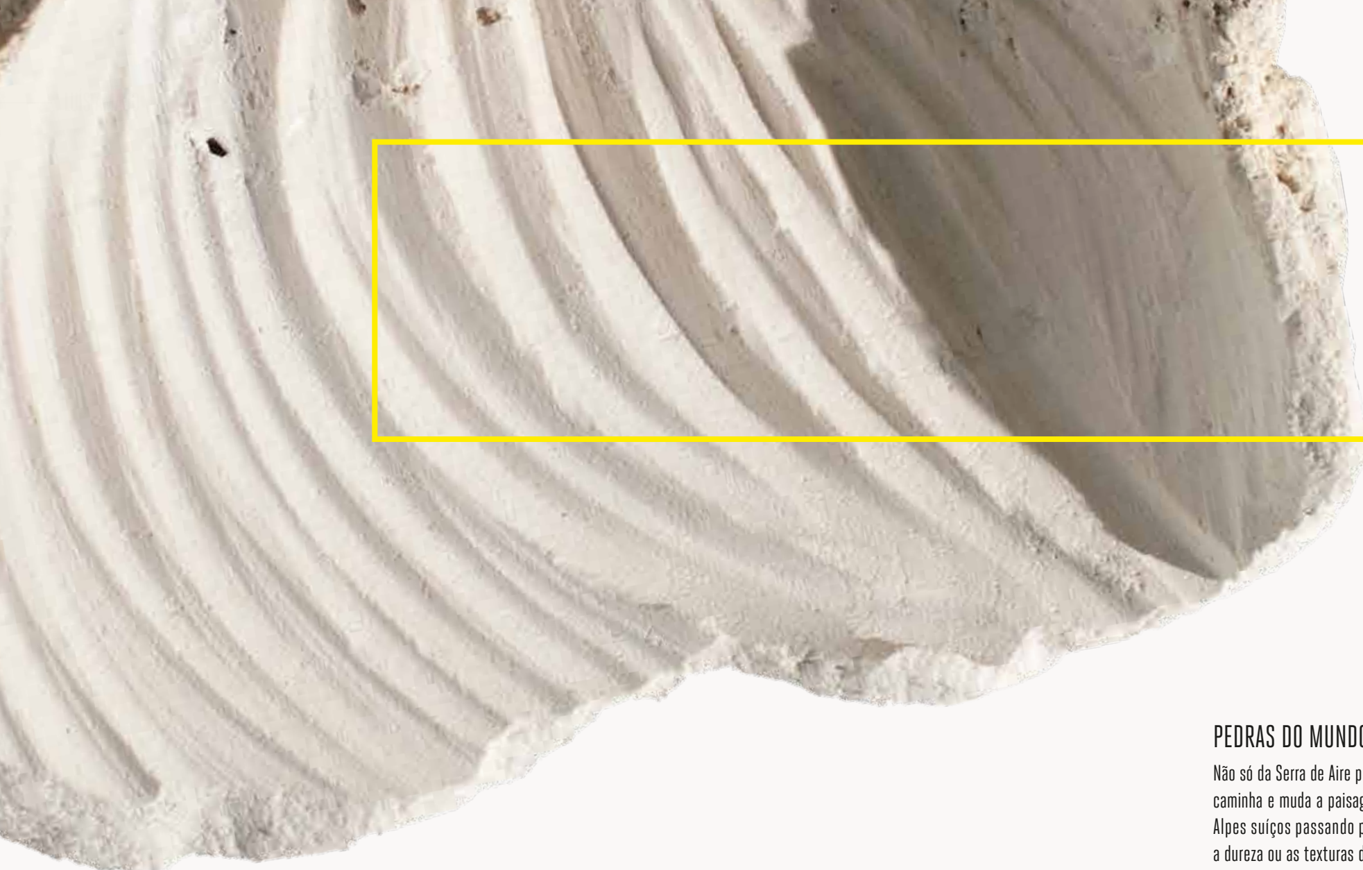
PEDRA DO MUNDO PM_073 ESCULTURA NA PEDRA, 14x19x7 CM ABU DHABI, EMIRADOS ÁRABES UNIDOS