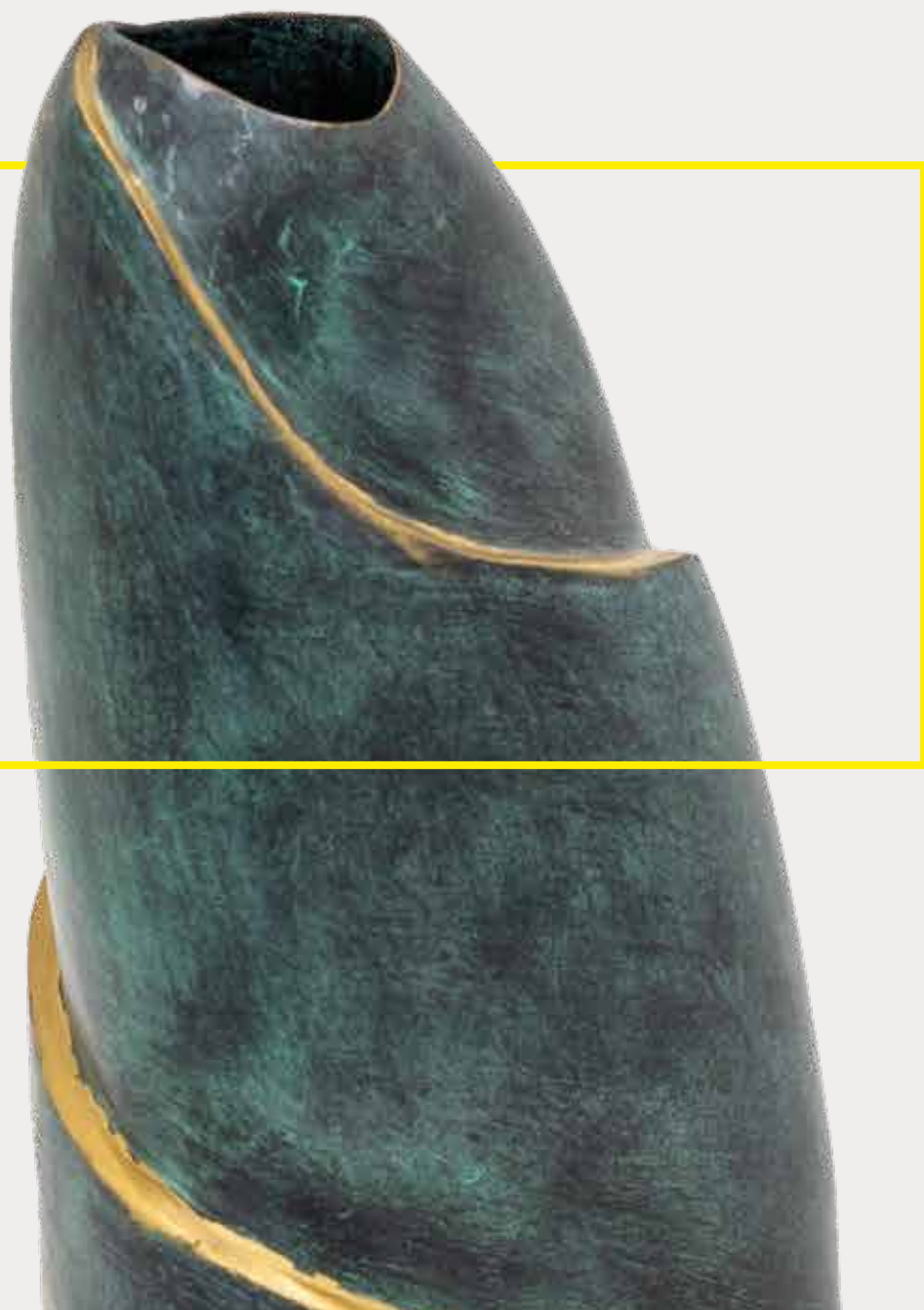
STONE BRONZE SB_032 BRONZE, 41x17x12 CM