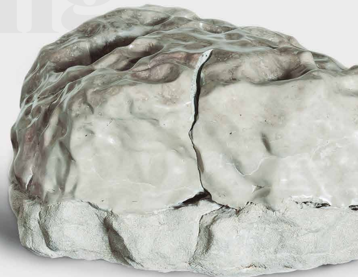
BRAINSTONING BS_005 CALCÁRIO BRANCO, 85x130x100 CM SERRA DE AIRE