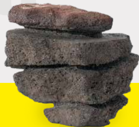
PEDRA COM HISTÓRIA PH_017 ESCALURA EM PEDRA, 10x11x11 CM MÉXICO