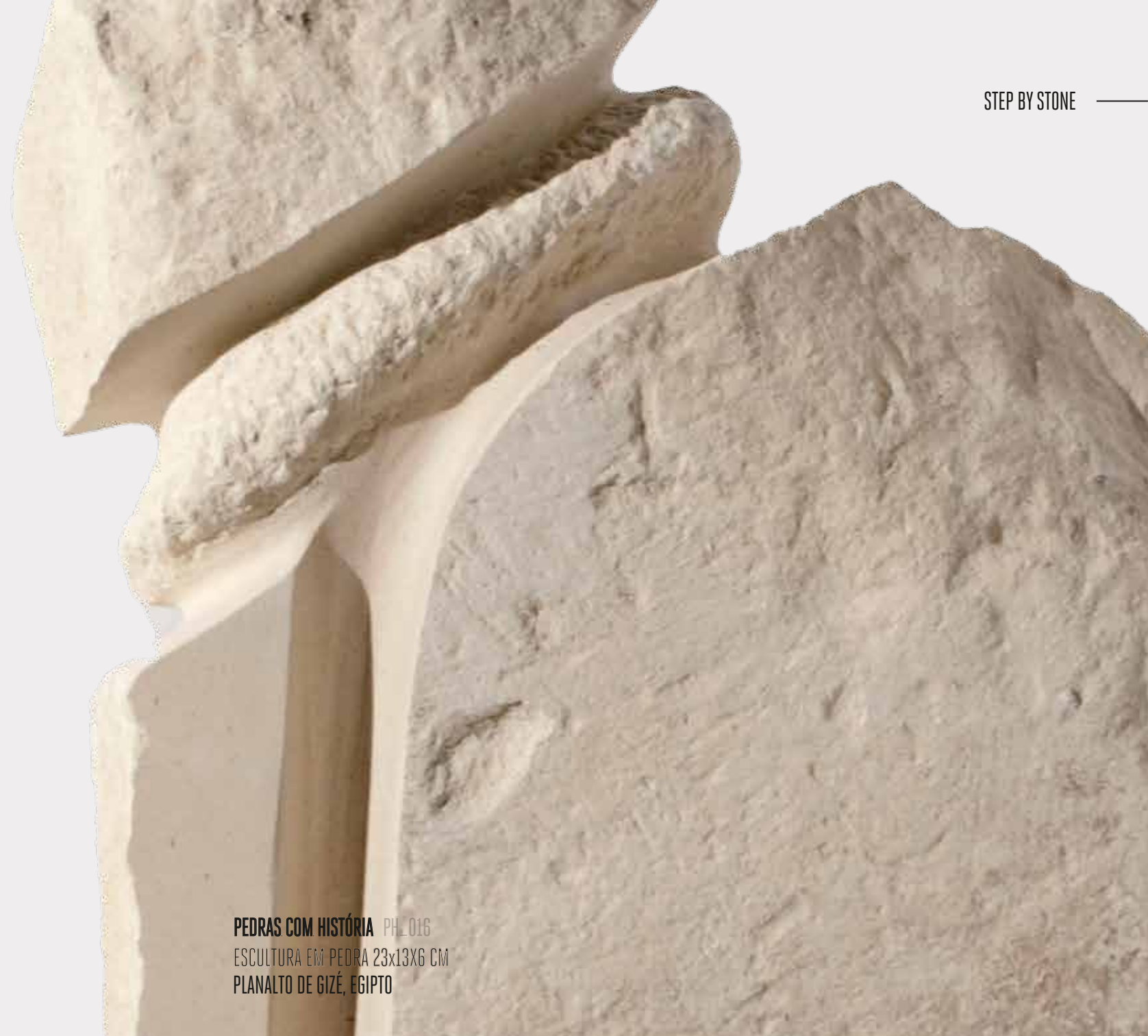
PEDRAS COM HISTÓRIA PH_016 ESCALURA EM PEDRA 23x13x6 CM PLANALTO DE GIZÉ, EGÍPTO