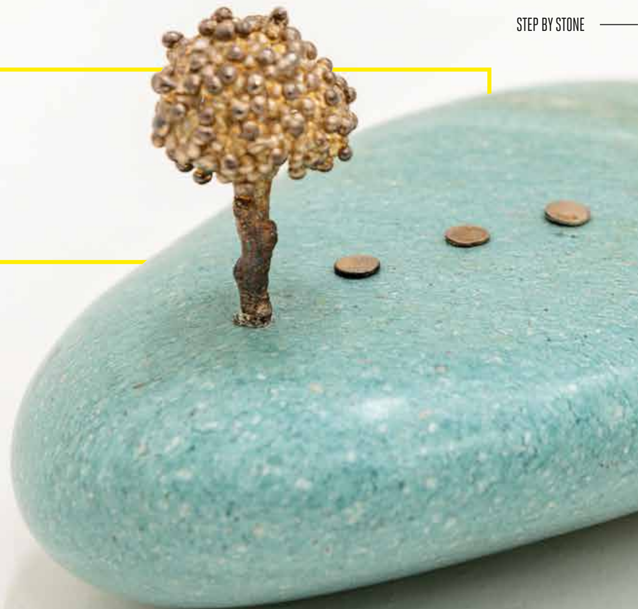
ILHA DOS AMORES IA_019 ESCULTURA NA PEDRA, 6x18x17 CM ILHA DAS FLORES, INDONÉSIA