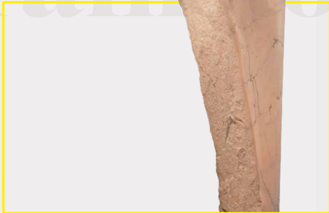
BRAINSTONING BS_003 MÁRMORE DE ESTREMOZ, 270x90x30 CM ESTREMOZ