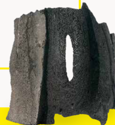
PEDRA DO MUNDO PM_057 ESCULTURA NA PEDRA 14x13x2 CM ILHA DE SANTIAGO, CABO VERDE